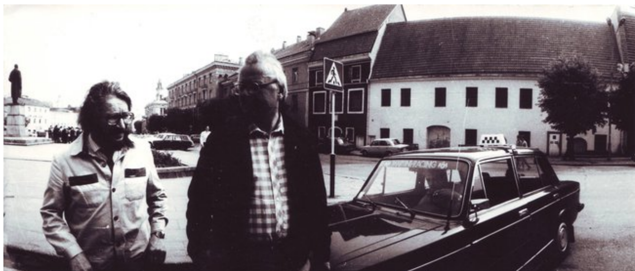
Bronius Kutavičius ir Sigitas Geda Vilniaus Rotušės aikštėje 1988 m.